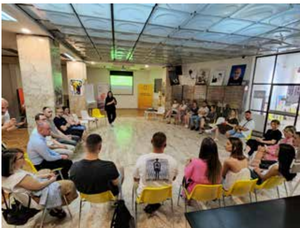
GI su bile domaćini studijskoj poseti Beogradu mladih iz Prištine - druženje sa studentima albanologije