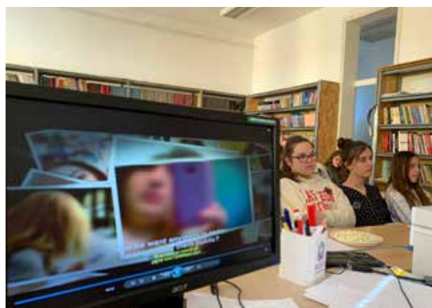
Bezbednost na internetu kao jedna od tema koje su obrađivane na časovima

Svojim angažovanim i interaktivnim pristupom, OWIS ima potencijal da poboljša i obogati iskustvo učenja kod đaka, pomažući da se stvori informisanije, kritičnije i aktivnije građanstvo.