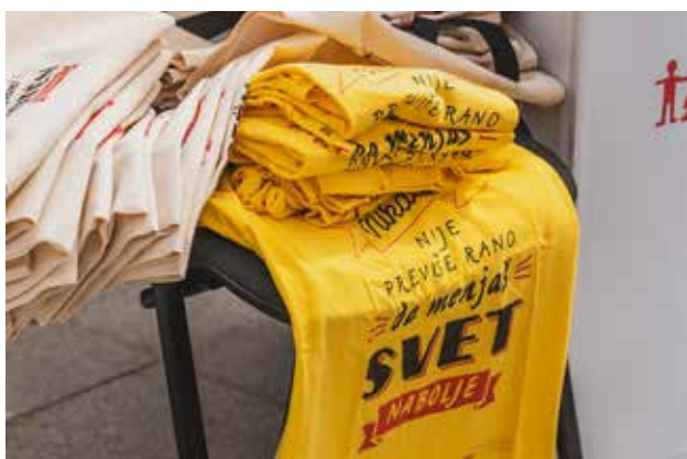
"Nikada nije previše rano da menjaš svet nabolje" - krilatica koja nas je vodila kroz ceo projekat

Jačanje formalnih i neformalnih udruženja građana na jugu Srbije bio je jedan od važnih zadataka projekta ALVED, jer samo osnažena i stabilna udruženja mogu aktivistički da deluju na duže staze, i nakon završetka podrške, kroz velike projekte kakav je ovaj. Treninzi i obuke organizovane su na osnovu potreba članova lokalnih udruženja: