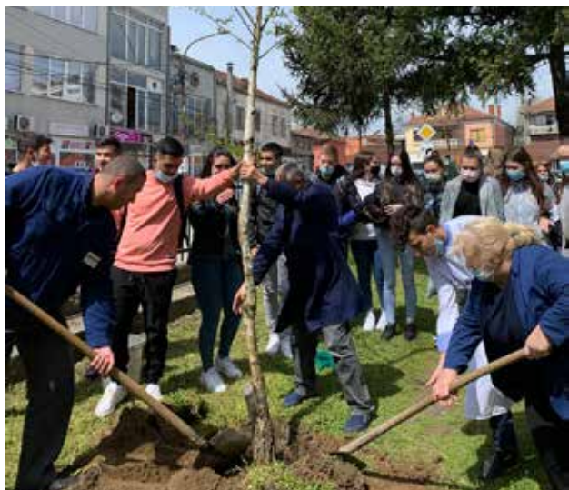
Sadnja stabala generacije u školama „Sveti Sava“ i „Sezai Suroi“; foto: GI