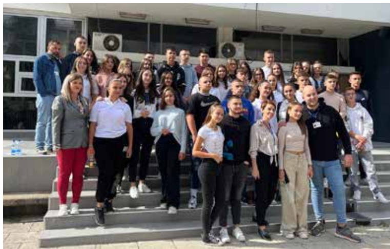
Lepota života u multietničkoj sredini - saradnja đачkih parlamenata škola „Sezai Suroi” i „Sveti Sava” u Bujanovcu je nešto čime se ALVED tim veoma ponosi; foto: Beyond

Rad sa mladima na jugu Srbije kao rezultat je, između ostalog, dao i osnivanje jedne formalne omladinske organizacije u Bujanovcu „Omladinski centar za promene”, i jedne neformalne u Lebanu. Pokrenuta je dugoročna saradnja između đачkih parlamenata škola „Sveti Sava” i „Sezai Suroi” u Bujanovcu, na osnovu koje su i dobili finansijsku podršku kroz projekat ALVED.