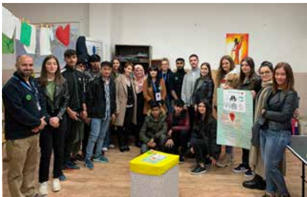
Film o migracijama i integracijama inspirisao je mlade iz Bujanovca da posete vršnjake u Prihvatnom centru u Preševu

Mladi u Bujanovcu su pokrenuli inspirativnu inicijativu da promovišu preventivnu zdravstvenu