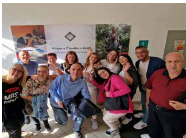
Poseta prostorijama People in Need u Pragu; foto: GI

donesu pozitivne promene u svetu. PSSP pristup svakako je pomogao da se poboljšaju socijalne usluge u ovim opštinama i ukazao na vrednost saradnje i uključivanja u kreiranje održivih i uticajnih programa.