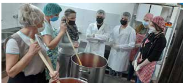
Radni dan u socijalnom preduzeću "Radanska ruža", Lebane