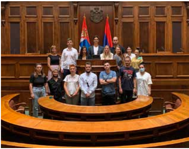
Obilazak Skupštine Srbije kao deo studijske posete Beogradu