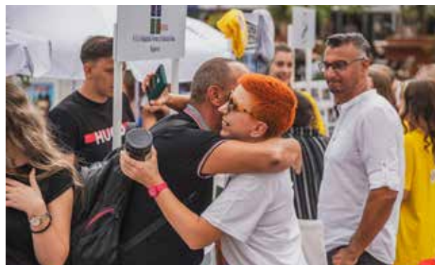
Kada poslovna saradnja preraste u prijateljstvo - Radanska ruža iz Lebana

Britanske ambasade i svih partnera, koje vode projekat ALVED, kao i rukovodilaca opština, pokazalo je lokalnim organizacijama da nisu same i da imaju podršku u svemu što rade u korist svojih sugrađana.