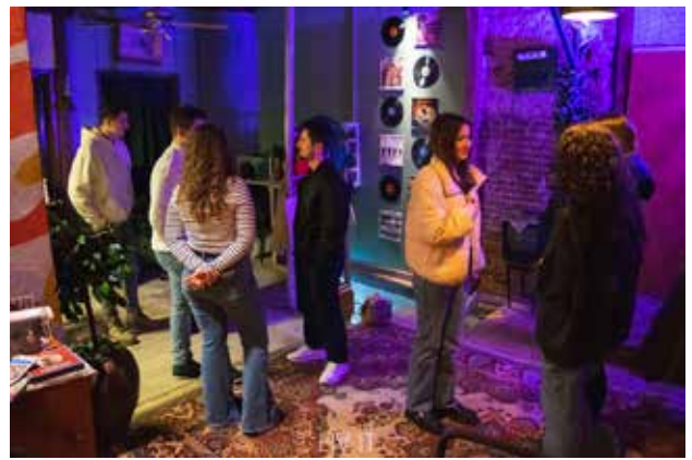
Filmsko veče u Preševu kao želja mladih da se bave temama iz OWIS filmova; foto: Livrit

zaštitu i saradnju među srpskom, albanskom i romskom decom. Kroz kreativne aktivnosti poput zajedničkih crteža i postera, uspešno su radili na podizanju svesti o značaju preventivne zdravstvene zaštite . Pored toga, organizovali su i predavanje kako bi istakli vezu između zdravlja i životne sredine. Inspirisani OWIS filmovima, stvorili smo