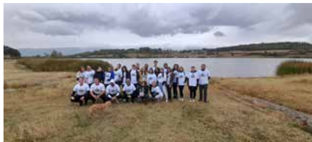
Čišćenje izletišta na Aleksandrovačkom jezeru, Vranje