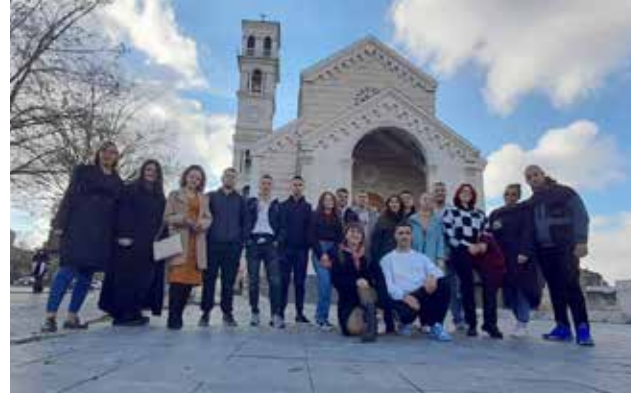
Obilazak Prištine tokom studijske posete; foto: GI

Razmena iskustava, mišljenja i stavova mladih iz svih opština nešto je na čemu se u okviru ALVED projekta insistiralo, jer učeći jedni od drugih, mladi postaju svestraniji i spremniji na život, ali i na aktivističko delovanje. Studijske posete mladih Beogradu 2021. i Prištini 2022. godine su događaji koji su u velikoj meri obeležili ovaj projekat.