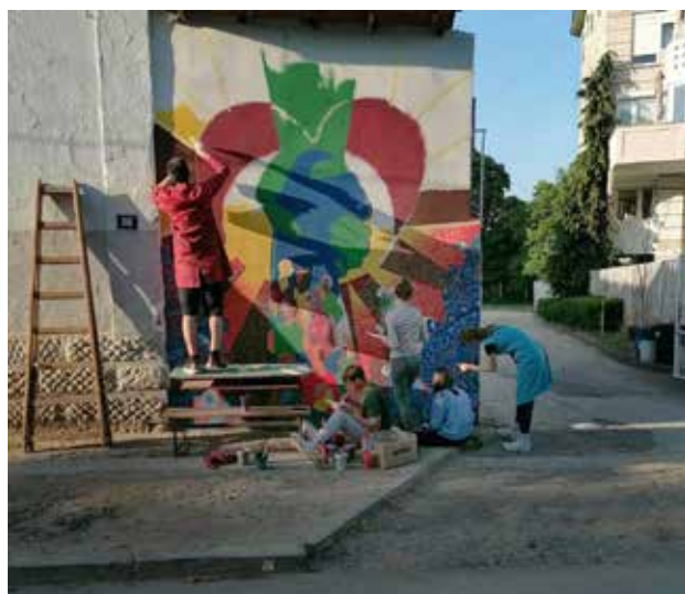
Izrada „Murala zajedništva“ u Vranju