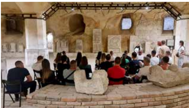
Obilazak podezmlja Beograda kao poseban doživljaj za učesnike studijske posete