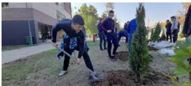
Uređenje dvorišta Hemijsko-tehnološke škole u Vranju