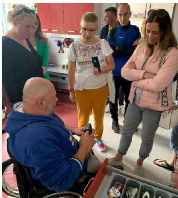
Obilazak kuhinje za trening korisnika u kućnim poslovima i nezavisnom životu za polaznike škole Jedličkúv ústav