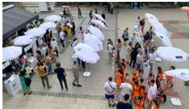
Sajam civilnog društva u Bujanovcu u organizaciji People in Need

mestu prikazao kakve sve inicijative postoje od građana iz Bujanovca, Lebana i Vranja, ali je bio i mesto na kome su se razmenjivale ideje i rodile nove saradnje. Takođe, prisustvo predstavnika