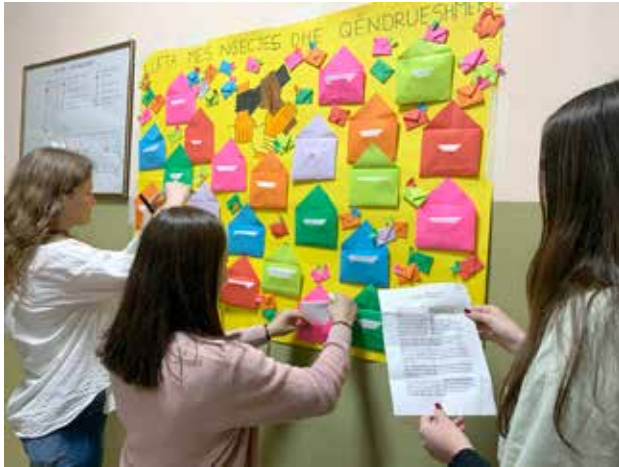
Učenici škole "Sezai Suroi" pisali su eseje inspirisane OWIS filmovima, koje su želeli da podele sa vršnjacima

Osnažujući i inspirišući mlade ljude da preuzmu akciju i pokrenu pozitivne promene u svojim zajednicama, OWIS prevazilazi jednostavne filmske projekcije. Inspirisani projekcijama OWIS dokumentarnog filma, mladi Bujanovčani su organizovali akciju