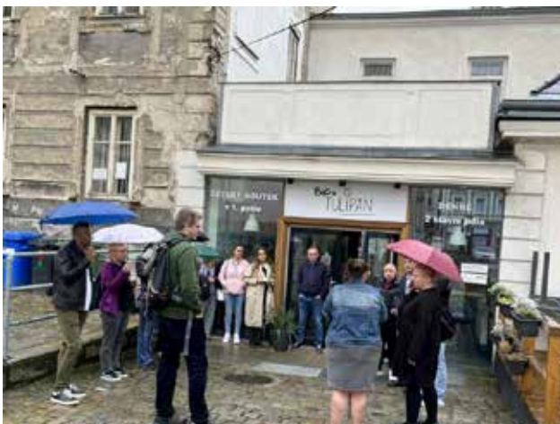
Poseta socijalnom preduzeću Tulipan u Liberecu u Češkoj

Da bi dalje unapredili svoje napore, predstavnici sve tri opštine učestvovali su u studijskoj poseti Češkoj. Kroz osmišljenu interakciju sa lokalnim organizacijama, socijalnim preduzećima i institucijama koje