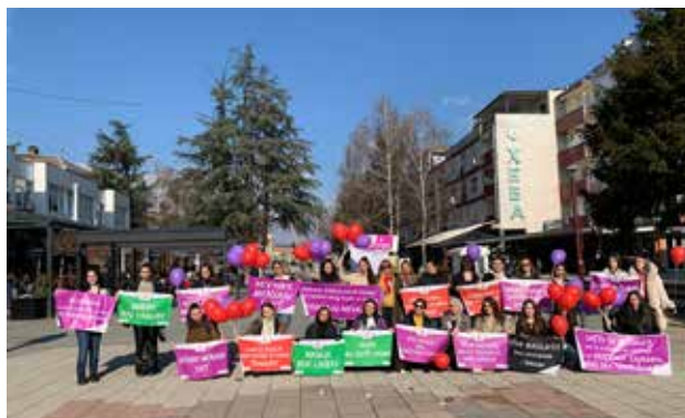
Mladi su bili i deo svetske kampanje „Jedna milijarda ustaje“, posvećene borbi protiv nasilja nad ženama, Bujanovac