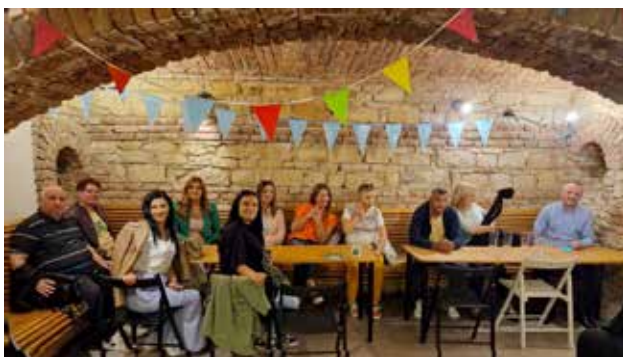
Poseta prostorijama PIN Programa za socijalne integracije

rade na pružanju usluga ugroženim grupama, 13 predstavnika iz Vranja, Bujanovca i Lebane steklo je sveobuhvatnu sliku o inovativnom i efikasnom pristupu pružanja socijalnih usluga. U osnovi naše misije je uverenje da obrazovanje i praktično iskustvo mogu da