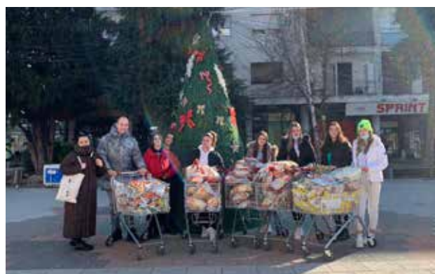
Prikupljanje i podela novogodišnjih paketića za decu iz socijalno ugroženih porodica bila je organizovana u Bujanovcu, Vranju, Preševu i Lebanu