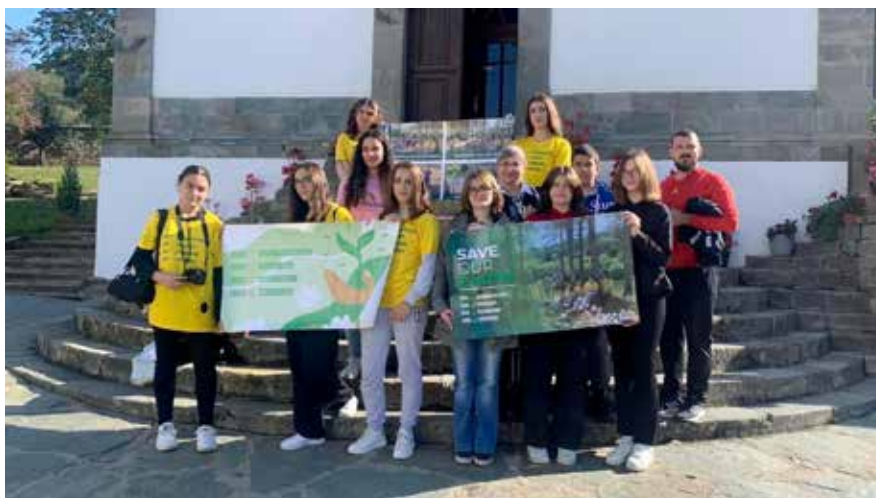
Kulturna humanitarna organizacija Alternativa Internacionale

PIN je isplatio približno 250.000 GBP primaocima grantova. Bila su 4.052 direktna korisnika grant projekata.