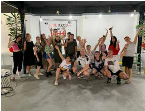
Dobro druženje je nešto što je svakako obeležilo studijsku posetu Beogradu; foto: GI