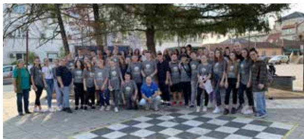
U čišćenju divlje deponije u Bujanovcu učestvovao je ogroman broj mladih