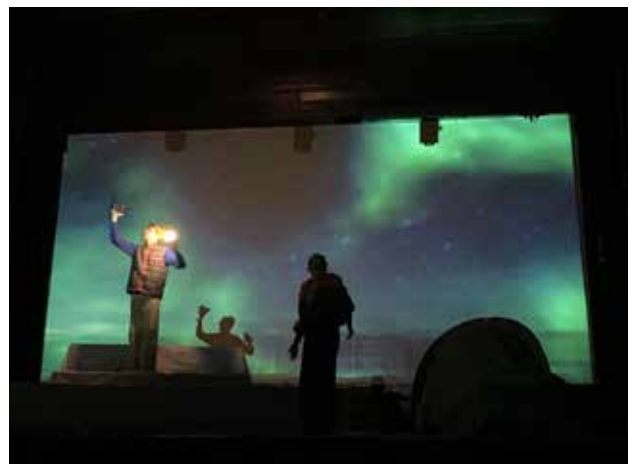
Predstavom „Na litići“ udruženja „Budi“ bavili smo se mentalnim zdravljem mladih; foto: GI

bezbedan i privlačan prostor za mlade ljude da otvoreno razgovaraju o mentalnom zdravlju . Pozorišna predstava „Na litići“, koja je odigrana u Vranju, Bujanovcu i Lebanu,