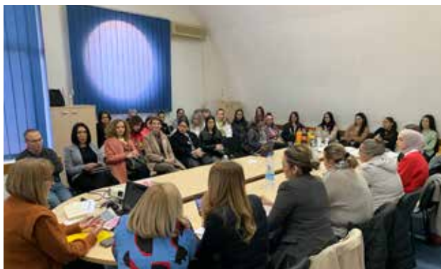
Obeležavanje Međunarodnog dana žena u Bujanovcu