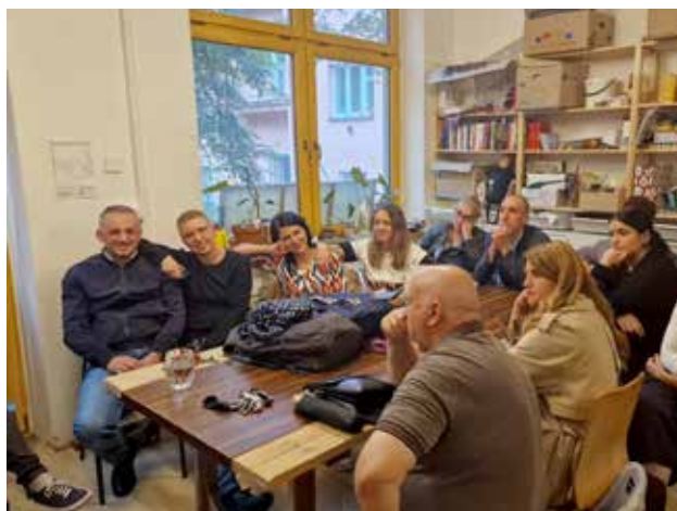
Obilazak organizacije koja brine o beskućnicama Jako doma (kao kod kuće); foto: Dragan Cvetković

rade na pružanju usluga ugroženim grupama, 13 predstavnika iz Vranja, Bujanovca i Lebane steklo je sveobuhvatnu sliku o inovativnom i efikasnom pristupu pružanja socijalnih usluga. U osnovi naše misije je uverenje da obrazovanje i praktično iskustvo mogu da