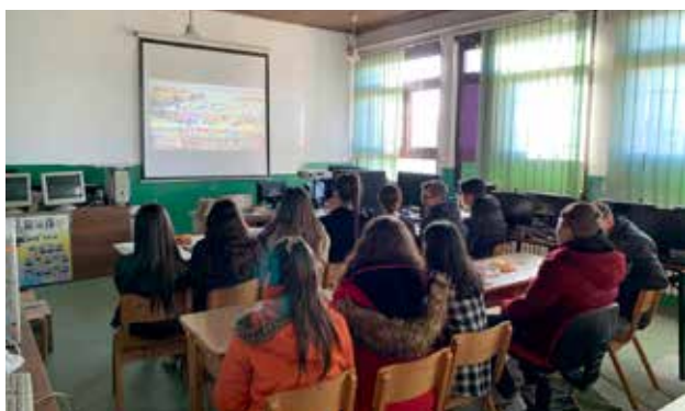
Svaki OWIS čas počinjao je projekcijom filмова

Inovativna nastavna metodologija „Jedan svet u školama” (OWIS) koristi dokumentarne filmove i interaktivne metode da inspiriše i obrazuje buduće generacije aktivnih i angažovanih građana. Razvijen od strane organizacije People in Need, OWIS pokriva niz važnih pitanja i dizajniran je da podstakne kritičko razmišljanje i promoviše dublje