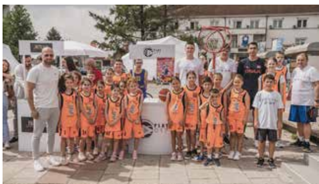
Omladinski košarkaški klub Play 017 Bujanovac, jer na mladima svet ostaje

Krajem avgusta 2022. godine u Bujanovcu je održan Sajam civilnog društva, na kome su se okupile organizacije sa juga Srbije, iz opština koje su deo projekta ALVED. Sajam je na jednom