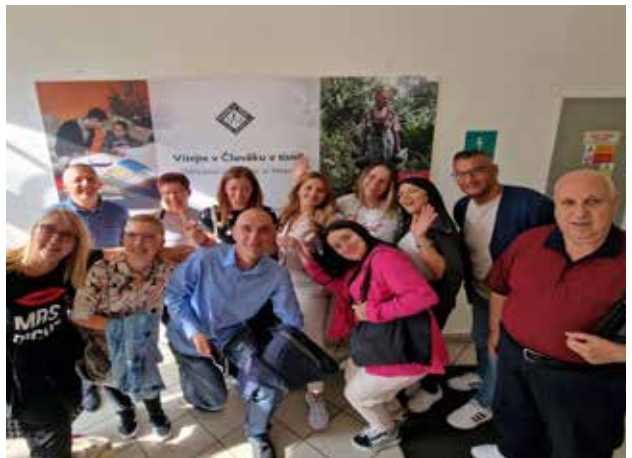
Vizitë në ambientet e organizatës Njerëzit në Nevojë (PIN) në Pragë, Republika Çeke

Qasja e PSSP ka ndihmuar dukshëm në përmirësimin e shërbimeve sociale në këto komuna dhe ka theksuar rëndësinë e bashkëpunimit dhe përfshirjes në krijimin e programeve të qëndrueshme dhe me ndikim.