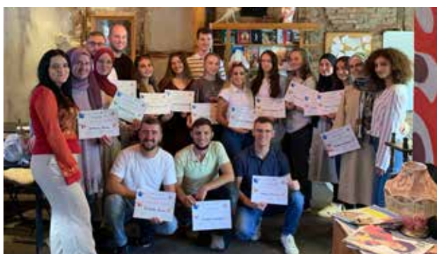
Kursi i gjuhës serbe në Preshevë tërhoqi interes të madh të rinjtë