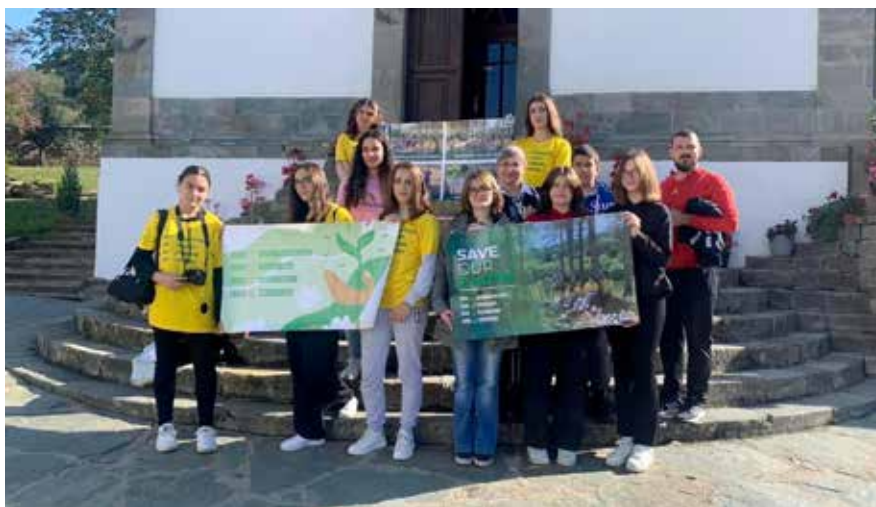
Organizata humanitare kulturore Alternativa Internazionale

PIN ka ndarë rreth 250.000 GBP për përfituesit e granteve. Numri i drejtpërdrejtë i pjesëmarrësve në projektet ishte 4.052.