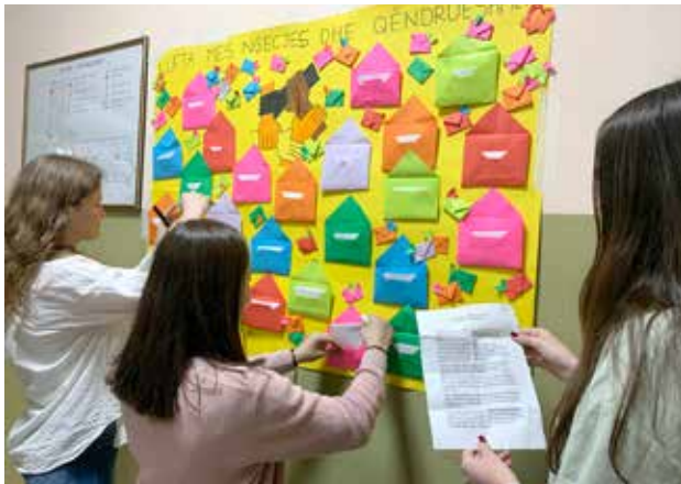
Të frymëzuar nga dokumentarët OWIS, nxënësit e shkollës "Sezai Surroi" shkruanë ese dhe i ndanë ato me shokët e tyre; foto: GI

Të frymëzuar nga filmat dokumentarë të OWIS, të rinjtë nga Bujanoci kanë organizuar një aktivitet për promovimin e përfshirjes sociale për migrantët.