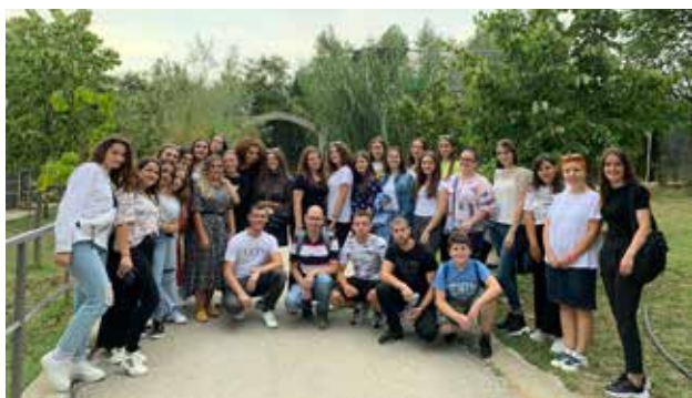
Orë të gjuhës serbe dhe angleze në natyrë, në Kopshtin zoologjik pranë Vranjës