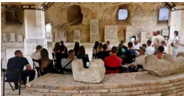
Një tur në nëntokën e Beogradit si një përvojë e veçantë për pjesëmarrësit e vizitës studimore; foto: PEN