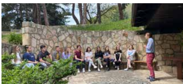
Trajnimi "Nga A në Barazi dhe Liri" në Vranjë