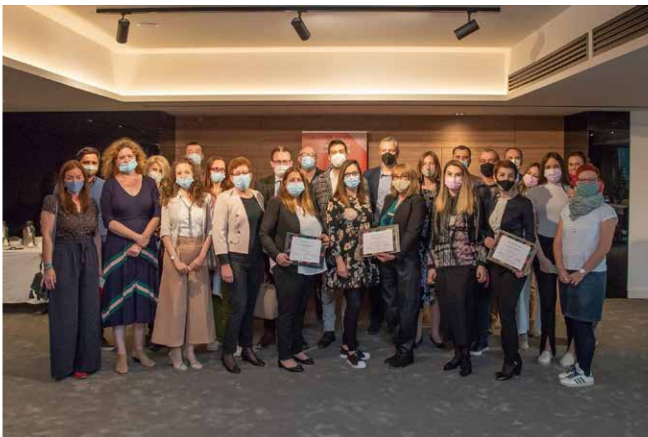
Shpallja e grantëve të para të ALVED - Ndikimi i pandemisë Covid-19 në komunitete