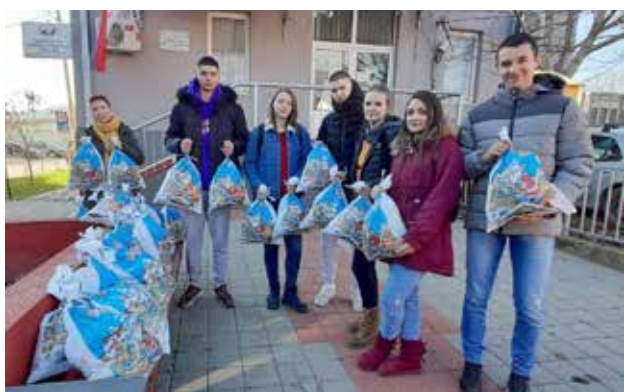
Shpërndarja e dhuratave të Vitit të Ri për fëmijët e privuar socialisht në Bujanoc, Vranjë, Preshevë dhe Leban