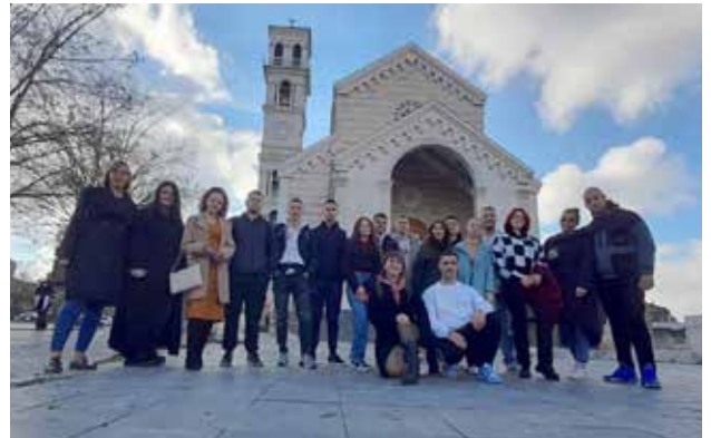
Turë në qytetin e Prishtinës gjatë vizitës studimore; foto: GI

ALVED theksoi dukshëm rëndësinë e shkëmbimit të përvojave dhe ideve midis të rinjve nga komunat e ndryshme. Ky theks u nxit nga të kuptuarit se përmes mësimit të ndërsjellët, të rinjtë mund të zhvillojnë përshtatshmëri dhe gatishmëri më të madhe për jetën, si dhe për t'u angazhuar në aktivizëm. Vizitat studimore në Beograd në vitin 2021 dhe Prishtinë në vitin 2022 ishin