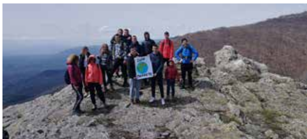
Shënimi i Ditës së Tokës - ngjitja në kodrën Shiljati Kamen pranë Vranjës