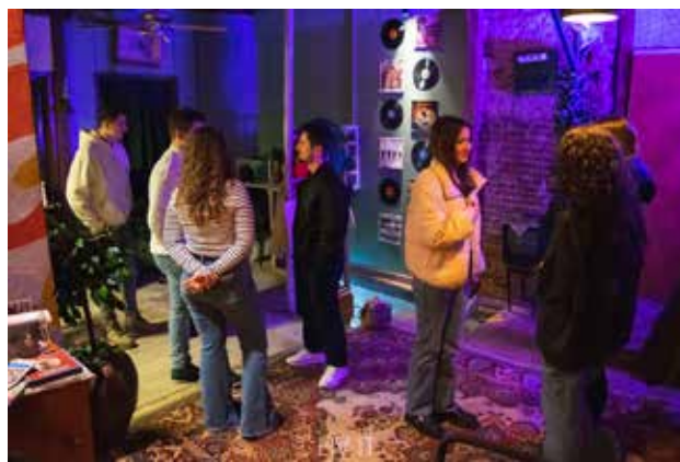
Mbrëmje e filmit në Preshevë, duke përbushur dëshirën e të rinjve për të eksploruar temat e dokumentarëve OWIS

Të rinjtë në Bujanoc shfaqën punë ekipore të jashtëzakonshme ndëretnike duke ndërmarrë një iniciativë frymëzuese për promovimin e masave mbrojtëse të kujdesit shëndetësor. Ata në mënyrë efektive ngritën ndërgjegjësimin për kujdesin shëndetësor përmes aktiviteteve si dizenjimi i posterave dhe vizatimeve të përbashkëta. Gjithashtu, ata organizuan leksione informative duke theksuar lidhjen midis shëndetit dhe mjedisit.