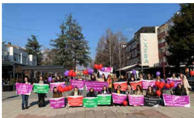
Të rinjtë e Bujanocit në mbështetje të fushatës botërore “One Billion Rising” kundër dhunës ndaj grave; foto: GI