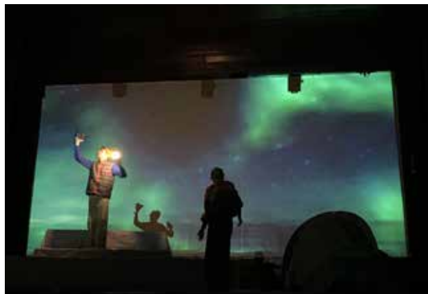
Përmes performancës teatrale të shfaqjes "Në shkëmb" nga shoqata "Budi", krijuam një platformë për diskutim mbi shëndetin mendor të të rinjve

Falë ndikimit të dokumentarëve OWIS, ne kemi krijuar një hapësirë të sigurt dhe tërheqëse për të rinjtë për të diskutuar hapur për shëndetin mendor dhe promovuar mirëqenien përmes dialogut të hapur . Shfaqja teatrale "Në shkëmb", e cila është