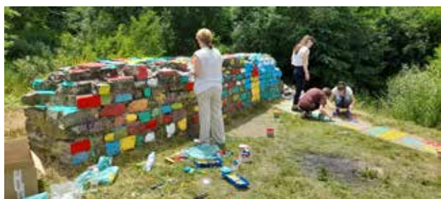
Rregullimi i kalatës buzë lumit Shimanka në Leban