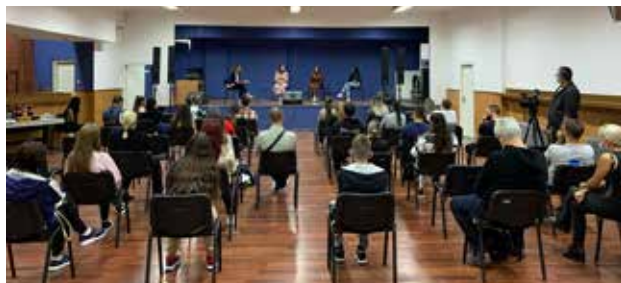
Panel diskutimi mbi pozitën e grave rome dhe performanca e grupit Pretty Loud në Vranjë