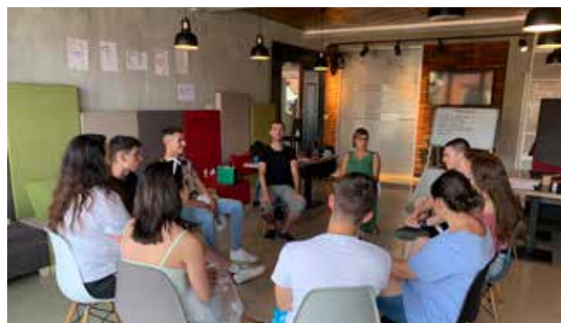
Trajnimi mbi barazinë gjinore në Leskoc