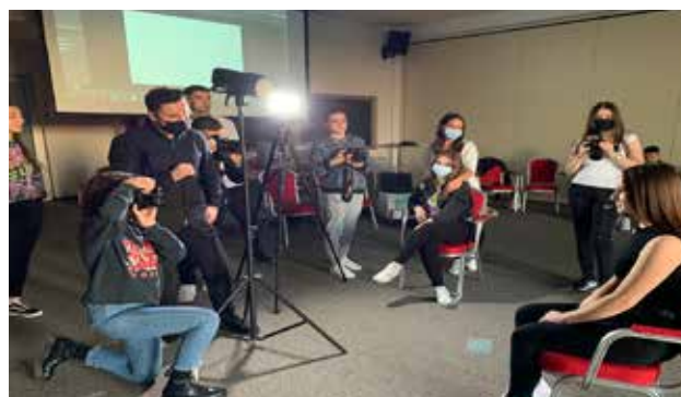
Trajnimi mbi fotografinë i organizuar në gjuhën shqipe dhe serbe