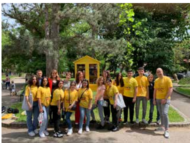
Hapja e shtëpizave të solidaritetit në Bujanoc, Vranjë, Preshevë dhe Leban