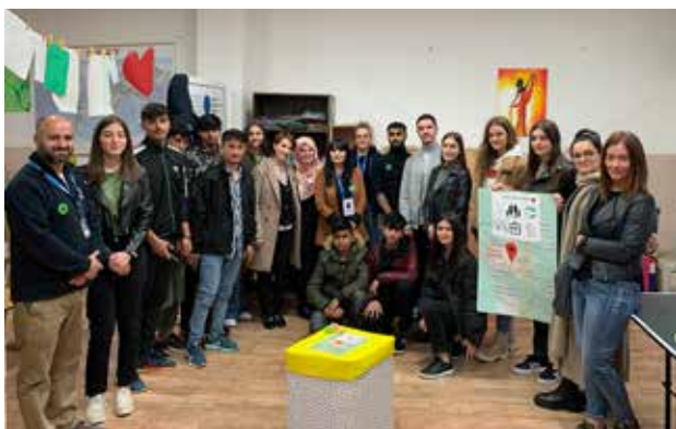
Dokumentari OWIS që trajton migrimin dhe integrimin i frymëzoi të rinjtë nga Bujanoci që të vizitojnë bashkëmoshatarët e tyre në Qendrën e Pranimit në Preshevë

Ata kanë shkruar ese mbi temën e luftës në mes përpjekjeve, vështirësive dhe qëndrueshmërisë të migrantëve dhe i kanë shfaqur ato në korridorin e shkollës që edhe nxënësit tjerë të mund ti lexojnë. Përveç kësaj, ata kanë vizituar Qendrën e Pranimit në Preshevë , në mënyrë që të lidhen me bashkëmoshatarët e tyre dhe t'i përcjellin një mesazh mbështetjeje, duke nxitur përfshirjen e tyre aktive në shoqëri.