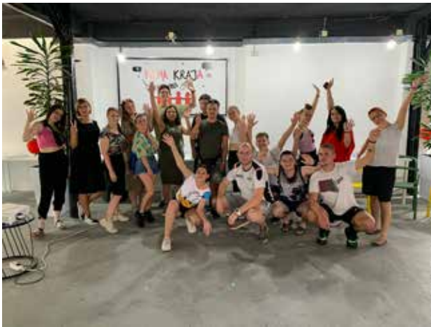
Vizita studimore në Beograd u karakterizua me shoqëri të shkëlqyer dhe momente vërtet të paharrueshme; foto: GI