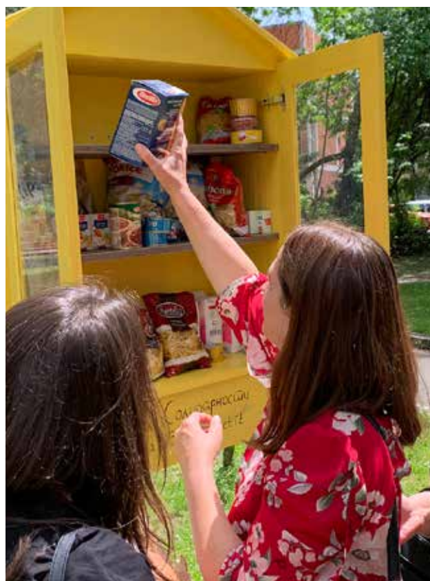
Hapja e shtëpizave të solidaritetit në Bujanoc, Vranjë, Preshevë dhe Leban