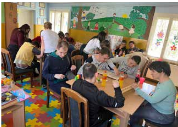
Fenniks: Prezantimi i puntorive të Qendrës së kujdesit ditor