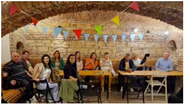
Vizitë në ambientet e Programit të Integritit Social të PIN

13 përfaqësues nga Vranja, Bujanoci dhe Leban morën një pasqyrë të qartë të qasjes inovative dhe efikase në ofrimin e shërbimeve sociale. Në thelb të misionit tonë është bindja se edukimi dhe përvoja praktike kanë aftësi të sjellin ndryshime pozitive në botë.