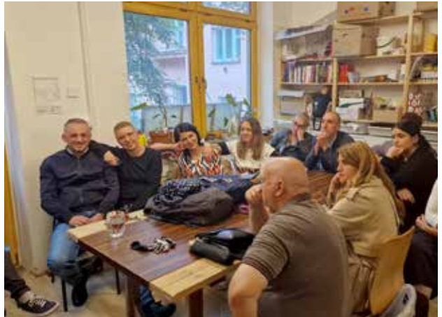
Vizitë në Jako Doma, një organizatë që ofron kujdes për gratë e pastreha

13 përfaqësues nga Vranja, Bujanoci dhe Leban morën një pasqyrë të qartë të qasjes inovative dhe efikase në ofrimin e shërbimeve sociale. Në thelb të misionit tonë është bindja se edukimi dhe përvoja praktike kanë aftësi të sjellin ndryshime pozitive në botë.