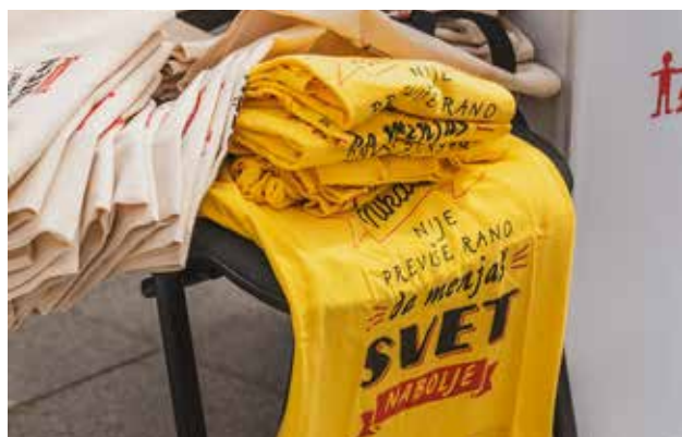
"Kurrë nuk është herët ta ndryshoni botën në të mirë" - Ky është slogani që na ka udhëhequr gjatë gjithë projektit; foto: Art Media Team, Vranjë

Fuqizimi i shoqërive civile formale dhe joformale në jug të Serbisë ishte një nga detyrat më të rëndësishme të projektit ALVED, sepse vetëm shoqëritë e fuqishme dhe të qëndrueshme mund të veprojnë aktivisht në afat të gjatë, edhe pas mbarimit të përkrahjes përmes projekteve të mëdha, siç është ky. Janë organizuar sesione trajnimesh në bazë të nevojave të anëtarëve të shoqërive lokale: