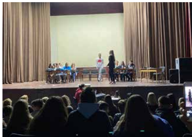
Forum teatër, shfaqje pa tekst nga shkollat "Sveti Sava" dhe "Sezai Surroi"; foto: Beyond