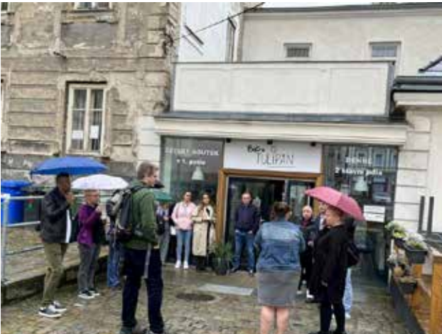
Vizitë në ndërmarrjen sociale Tulipan në Liberec, Republika Çeke

Për të avancuar më tej me përpjekjet e tyre, përfaqësuesit e tre komunave morën pjesë në vizitën studimore në Republikën Çeke. Përmes ndërveprimit me organizatat lokale, ndërmarrjet sociale dhe institucionet që punojnë për të ofruar shërbime sociale për grupet e rrezikuara,