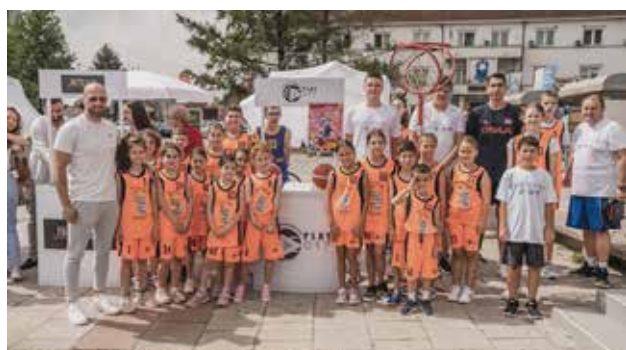
Klubi i basketbollit "PLAY 017" në Bujanoc, sepse bota varet nga të rinjtë; foto: Art Media Team, Vranjë

Në gusht të vitit 2022, në Bujanoc është mbajtur panairi i shoqërisë civile, në të cilin janë mbledhur organizatat nga jugu i Serbisë, kryesisht komunat të cilat janë pjesë e projektit ALVED. Panairi tregoi