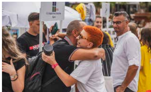
Kur bashkëpunimi i punës kthehet në miqësi - Radanska ruzha nga Lebani

gjithë partnerëve, pjesë të projektit ALVED, si dhe udhëheqësve të vetëqeverisjeve lokale, i tregoi organizatave lokale se nuk janë vetëm dhe se kanë mbështetjen e tyre në çdo gjë që do të ndërmarrin në të mirë të bashkëqytetarëve të tyre.