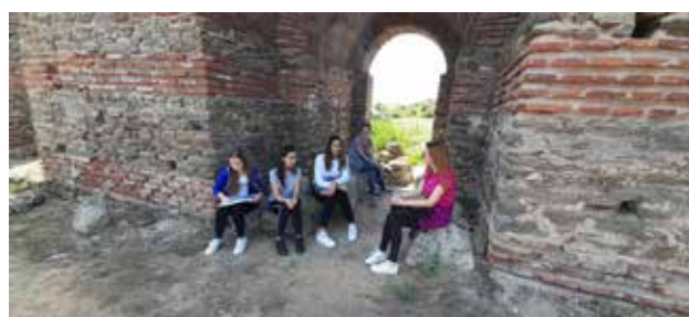
Kursi i gjuhës angleze në natyrë pranë vendit arkeologjik Justiniana Prima, Leban